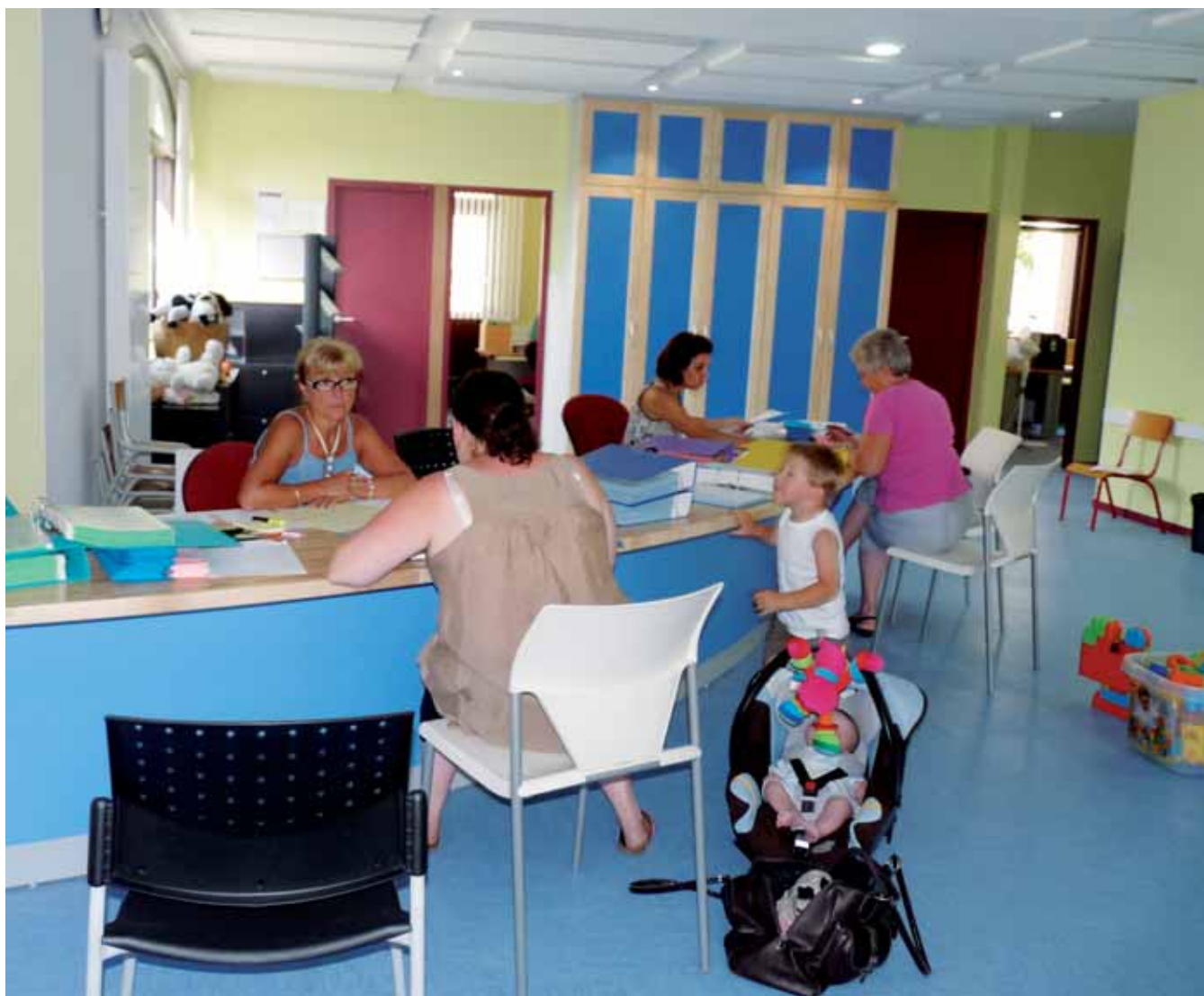
▲ Le guichet unique est en place !

A chaque rentrée son lot de nouveautés ! Cette expression prend tout son sens à Sassenage en ce mois de septembre. Des nouveautés toutes guidées par la volonté affichée d'améliorer toujours plus les services proposés aux Sassenageois. Ainsi, depuis trois ans, la Ville est engagée dans une démarche qualité visant l'amélioration continue de l'accueil des usagers dans tous les services à la population. Entre autres mesures d'actualité pour cette rentrée, l'installation d'un calendrier de fréquentation, affiché à l'entrée des services recevant du public, indiquant les