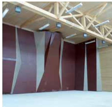
▲ Le mur d'escalade