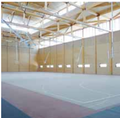
▲ Le plateau