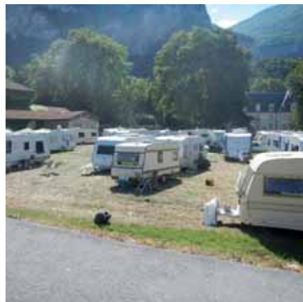
▲ Caravanes devant le Château

Poursuite et fin des aménagements de sécurisation. ■