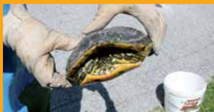
▲ Tortue de Floride trouvée en juin par un riverain dans le ruisseau du Gua.

Peut-être avez-vous déjà vu ces petites tortues aquatiques à peine plus grosses qu'une pièce d'un euro ? Appelées tortues de Floride ou tortues à tempes rouges, ces carnivores, en grandissant, peuvent mesurer jusqu'à trente centimètres, peser trois kilogrammes, et vivre jusqu'à soixante ans !