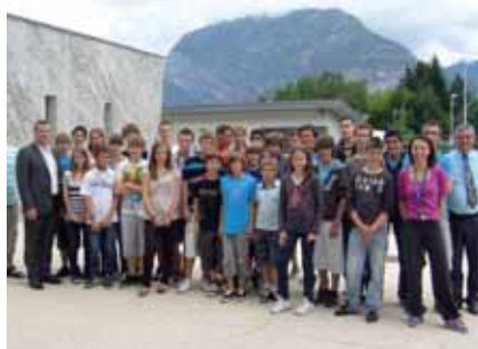
▲ Les jeunes de l'association sportive du collège Fleming récompensés

Les excellentes performances réalisées durant l'année par les élèves de l'association sportive du collège Fleming (1) ont été saluées lundi 25 juin lors d'une réception organisée au collège : 1 er du championnat de district Grenoble nord en badminton sur dix-sept collèges, 4 ème place au championnat académique de VTT, qualification de huit élèves au championnat de France de raid nature, 1 ère place au championnat académique de tennis de table et 7 ème place au championnat de