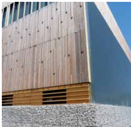
▲ Le gymnase Fleming, vu de l'extérieur