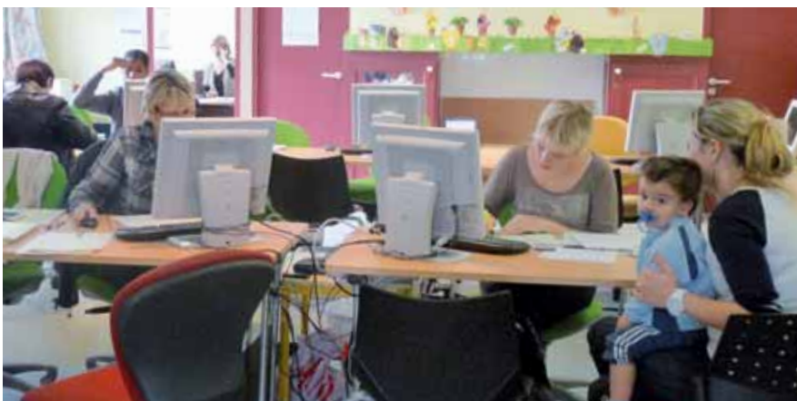
▲ Avant l'aménagement du guichet unique

sont désormais mieux identifiables. Le guichet unique est donc une aubaine pour les parents pressés ! ■