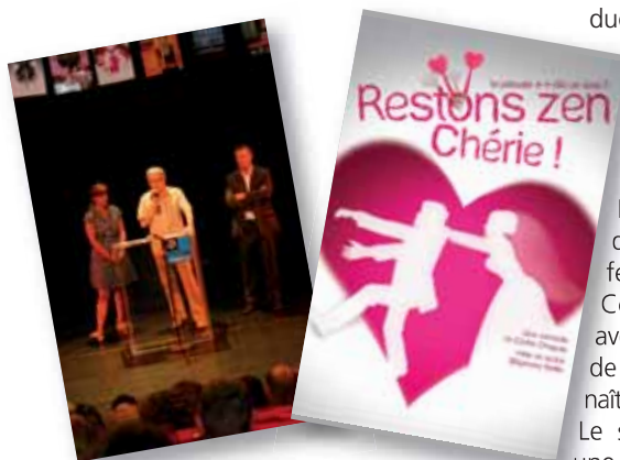
▲ Présentation de saison le 25 juin