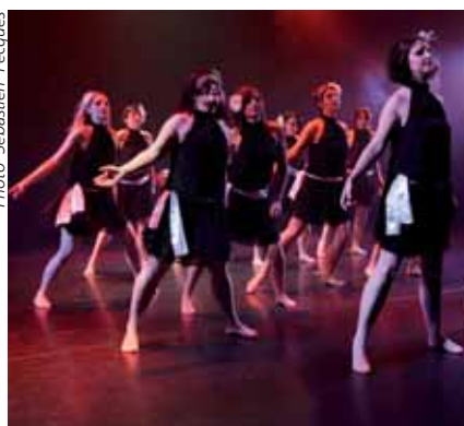
▲ Le cours de danse jazz adultes